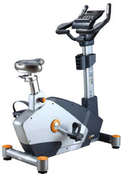
VÉLO ERGOMETRE EB2100i