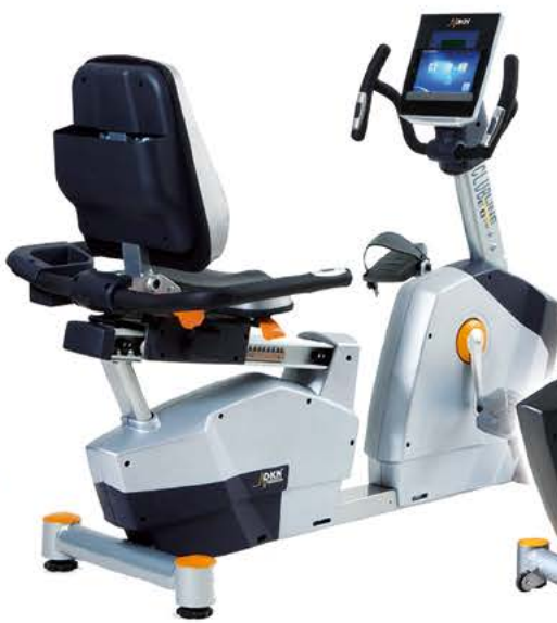
VÉLO SEMI-ALLONGÉ EB3100i